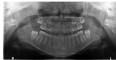
Ryc. 1. RTG pantomograficzne pacjentki przed leczeniem. Widoczne zęby 15 i 25 zatrzymane w szczęce

W wyżej opisanym przypadku prawdopodobną przyczyną zaburzenia miejsca w łuku dla zębów przedtrzonowych była przedwczesna utrata mlecznych zębów trzonowych. Badania obrazowe pozwoliły szybko zdiagnozować problem i zaplanować leczenie. Badaniem pierwszego rzutu w diagnostyce zębów zatrzymanych i nieprawidłowo wyrzynających się