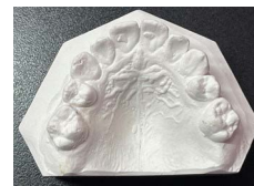
Ryc. 2. Model zębów szczęki pacjentki przed leczeniem. Widoczny brak zębów przedtrzonowych drugich