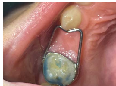
Ryc. 7. Stały utrzymywacz przestrzeni u 6-letniego pacjenta, który przedwcześnie utracił ząb 54