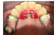
Ryc. 3. Łuk górny pacjentki pod koniec leczenia aparatem GMD