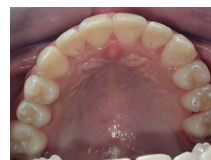
Ryc. 5. Zęby górne pacjentki po uszeregowaniu aparatem stałym cienkołukowym