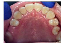
Ryc. 4. Zęby szczęki pacjentki po demontażu aparatu do dystalizacji