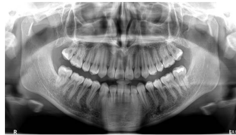
Ryc. 6. RTG pantomograficzne pacjentki w fazie retencyjnej leczenia, po wyrznięciu zębów drugich trzonowych stałych

Przedwczesna utrata zębów mlecznych z powodu powikłań choroby próchnicowej jest wciąż palącym problemem (10, 20-22). Może ona prowadzić do zmian w obrębie układu stomatognatycznego, takich jak: przerwanie ciągłości łuku zębowego, przemieszczenia zębów, utrata przestrzeni koniecznej do prawidłowego wyrznięcia zębów stałych, skrócenie łuku, zaburzone wyrzynanie zębów stałych (10). Należy pamiętać, że gdy utrata dotyczy zębów trzonowych, szczególnie jeżeli ząb mleczny w bocznych odcinkach łuków zębowych musi być usunięty na długo przed terminem fizjologicznej eksfoliacji, pacjent powinien zostać zabezpieczony ortodontycznie. Należy wykonać u pacjenta utrzymywacz przestrzeni, który uchroni go przed następstwami przedwczesnej utraty zęba (mezjalizacja zębów bocznych, pochylenie zębów w kierunku luki, efekt Godona), zapewniając utrzymanie odpowiedniej przestrzeni lub jej odtworzenie (22). W tym celu mogą być zastosowane zarówno utrzymywacze zacementowane w jamie ustnej na stałe, jak i aparaty zdejmowane z zablokowanym miejscem po utraconym zębie (ryc. 7, 8). Analiza przeglądu piśmiennictwa dokonana przez Gibas-Stanek i Lostera wskazuje, że utrzymywacz przestrzeni powinien być wykonany w każdym przypadku utraty pierwszego mlecznego zęba trzonowego, gdy stały ząb pierwszy trzonowy jest niewyrznięty lub jest kontakt guzkowy (22). Ekstrakcja mlecznego